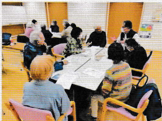
認知症ケア研究会の様子

11月に開催した内容では、認知症の症状がある方本人の視点、思い、そしてケアを行う家族の思いということを中心に、認知症の当事者、当事者家族、一般市民、認知症の地域支援グループである「チームオレンジ」や各ボランティアの方々も参加し、本人の視点や思いを理解した上での関わり方等を映像で共有し、意見交換を行いました。「認知症になると何もできなくなる」といった古い認知症観から、出来なくなることもあるが、出来ることもたくさんあり、周囲の理解や支えによって出来ることも増え、充実した生活を送ることも出来、初期の対応によってその後の本人や家族の生活、精神、健康に大きく影響を及ぼす大切なことであることも学びました。認知症に関する理解と少子高齢化による環境の変化は確実に進んでいます。基本的な考えに加えて、毎回のテーマやメッセージの対象等考えつつ、より効果的な内容で開催を行っていきたいと思います。