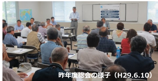
昨年度総会の様子 (H29.6.10)

六甲アイランドまちづくり協議会が発足して12年目を迎えました。これまでの活動も、多くの住民の皆様と団体・事業者のご協力・ご支援の賜物と感謝しています。毎月の委員会では、委員の皆様から、街を少しでも良くしたいとの積極的なご意見や要望が寄せられ、島内団体などと協働し、また行政の理解と支援を得ながら解決するべく活動しています。今後とも、皆様のご協力とご支援をよろしく願っています。