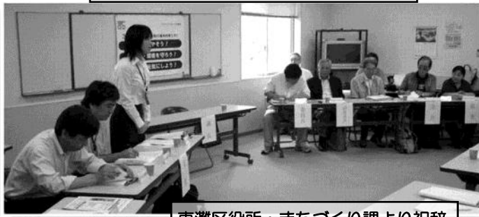
東灘区役所・まちづくり課より祝辞